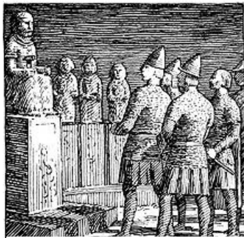
Olav in de tempel van Thor

In de eerste scène vaart Olav Trygvason met zijn schip "Lange Slang" over de Noordzee. In de verte doemt de ontoegankelijke Noorse kust op. Na een moeizame zoektocht wordt een gunstige landingsplaats gevonden. Aangeland ontrolt zich het prachtige land in 'lentepracht':