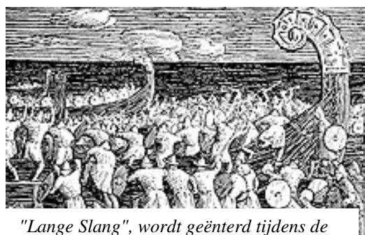
"Lange Slang", wordt geënterd tijdens de Slag van Svolder

Hiermee eindigt het lied, dat in een ware jubelzang de intocht van Olav Trygvason, koning van Noorwegen van 995-1000 beschrijft. De geschiedenis vermeldt dat Olav Trygvason er inderdaad in slaagde de Vikingen te bekeren tot het Christendom. Hij wordt koning van Noorwegen. In 1000 gaat hij de confrontatie aan met de Zweden, Denen en de manschappen van de Noorse jarl (graaf) Eirik Håkonsson in de Slag van Svolder, een zeeslag in de westelijke Oostzee. Zijn vloot van 11 schepen gaat ten onder tegen een vloot van 70 schepen. Al snel wordt Olav Trygvason verslagen. Hij springt van zijn schip, de "Lange Slang", en verdrinkt. Een roemloos einde.